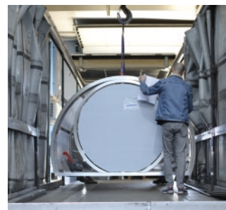
Conditionnement et transport optimisés

Nous concevons, fabriquons et gérons 100% sur place