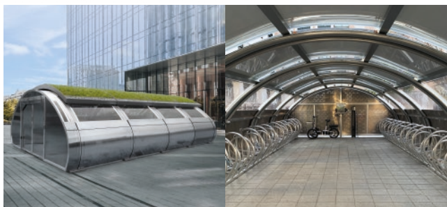
Solutions pour réduire l'empreinte carbone