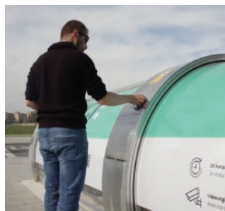
Compatible avec tout contrôle d'accès